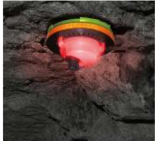
2단계 : 트리거 (위험) (변위발생 즉, 위험경보 표시)